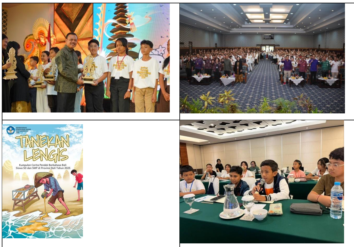
Gambar 2. Festival Tunas Bahasa Ibu dan Kemah Cerpen (2025)

penutur muda melakukan "persembunyian linguistik," di mana mereka memahami bahasa daerah tetapi enggan menggunakannya dalam komunikasi aktif.