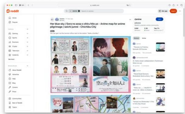
Gambar 2. Interaksi penggemar di media sosial mengenai aktivitas pilgrime.

kegiatan kunjungan atau ziarah suci para penggemar anime terhadap lokasi-lokasi yang digunakan dalam karya anime. aktivitas pilgrime ini dapat dilihat dari adanya interaksi para penggemar yang membagikan informasi serta pengalaman mereka dalam melakukan pilgrime pada media sosial.