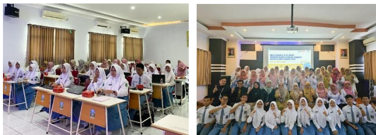
Gambar 2.1. Pelaksanaan Pelatihan Literasi Keuangan Digital

Efektivitas pelatihan dievaluasi berdasarkan analisis hasil post-tes yang diberikan kepada siswa dan guru SMA Negeri 1 Waru.