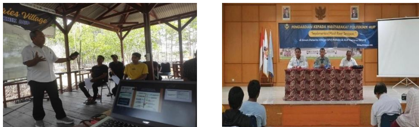
Gambar 3.1. Pelaksanaan penyampaian materi PKM

Langkah pertama dalam pelaksanaan kegiatan adalah melakukan sosialisasi yang bertujuan untuk meningkatkan kesadaran masyarakat pesisir Serang tentang pentingnya praktik perikanan yang ramah lingkungan. Sosialisasi ini akan dilakukan melalui Pertemuan Kelompok Nelayan dan Penyuluhan tentang Regulasi Pemerintah.