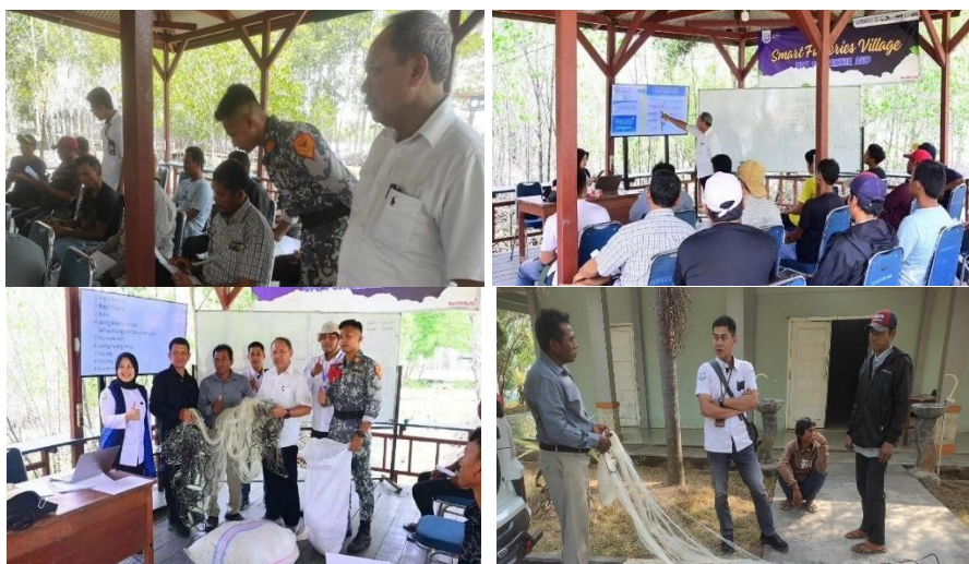
Gambar 3.2. Pelatihan dan Demonstrasi Teknik Perikanan Ramah Lingkungan