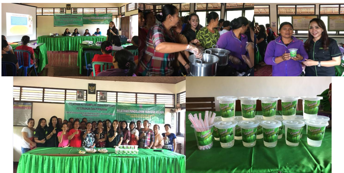
Gambar 3.1. Proses pelaksanaan dan dokumentasi kegiatan